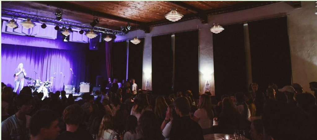
Fuldt hus til SUPs første jam session i Kultur Café Ludvig

SUP: Vi hjalp tre unge fra Sorø Akademi på vej med Sorø Ungdomsprojekt SUP, en ny forening der skaber mere kultur for unge i Sorø. Med fokus på fællesskab har de dannet en platform, hvor unge kan mødes. Og de har et stærkt samarbejde med Kultur café Ludvig og Sorø Musikskole.