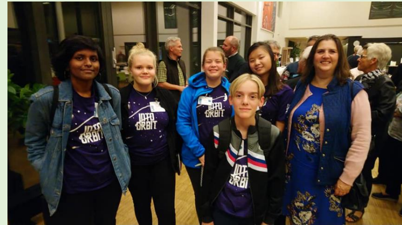
Unge Journallister på Frivillig Fredag hos VKST

Unge Journalister: Et projekt, hvor vi støtter op om en gruppe unge på 13-16 år med interesse for journalistik- og foto. Deres første opgave blev at dække Frivillig Fredag. Det kom der en fin folder ud af, som bl.a. er tilgængelig på bibliotekerne og på Frivilligcentrets hjemmeside.